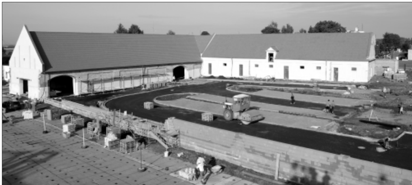
Obr. 19. Současný stav areálu – pohled k jihozápadu, objekty C1 a C2 (nahore), pohled k severozápadu, objekty A2, A3 a A4 (dole)