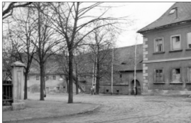
Obr. 3. Jiný dobový pohled na hospodářský dvůr

Jak naznačují kusé historické informace, dvůr v Dobrovici mohl existovat již ve středověkém období. O jeho podobě ale nejsou dochovány žádné informace. Jen hypoteticky lze předpokládat, že byl situován na shodném místě, jako dvůr dnešní,