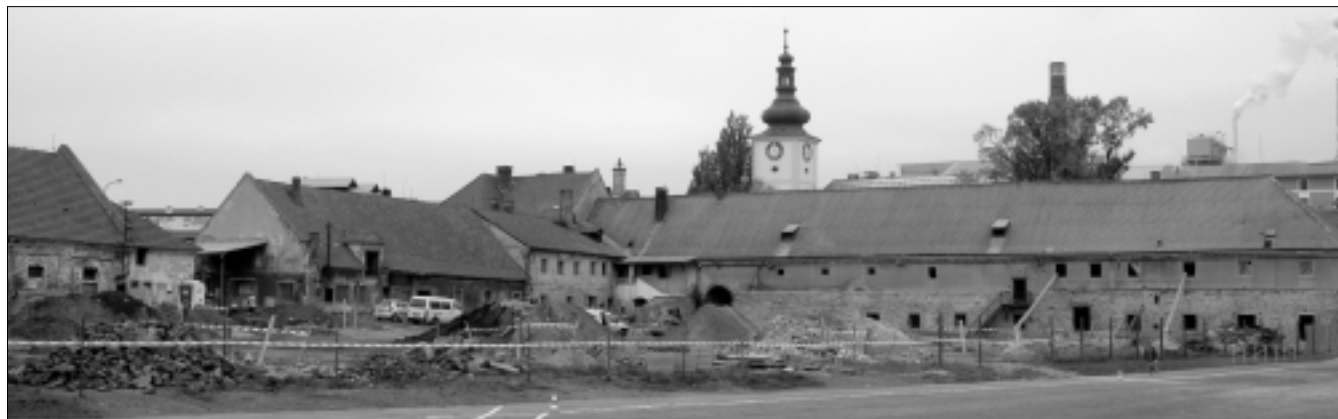
Obr. 5. Hospodářský dvůr v Dobrovici po zahájení prací na podzim 2008 (budovy C1, A4, A3 a A2, v pozadí zámek s cukrovarem)

Areál hospodářského dvora v Dobrovici je zapsán v ústředním seznamu nemovitých kulturních památek. Navíc je součástí dobrovického zámku, který je další významnou kulturní památkou. Dvůr je přes vnější, poněkud nenápadný vzhled mimořádně hodnotnou architekturou s převažující renesanční, barokní a klasicistní dispozicí. V rámci regionu Mladoboleslavska i v rámci středních Čech je (spolu s goticko-renesančním dvorem u nedalekého hradu Zvířetice) významnou ukázkou hospodářského areálu, jehož původ sahá nejpozději do druhé poloviny 16. století. Renesanční stavební etapa, dochovaná v takto neobvykle velkém rozsahu, činí z hospodářského dvora v Dobrovici jednu z nejvýznamnějších památek svého druhu na území středních Čech.