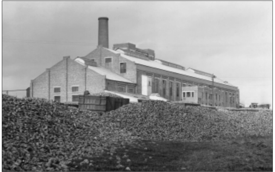
Obr. 3. Cukrovar Wisington v Anglii na konci 20. let

se tedy rozhodl pro jiné řešení – odejde do světa. Na inzerát si sehnal místo v anglickém cukrovaru Wisington a během šesti týdnů před odjezdem se naučil základy angličtiny.