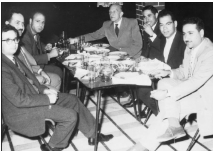
Obr. 7. V Sýrii při rozloučení se spolupracovníky z cukrovaru Homs, 21. 10. 1961