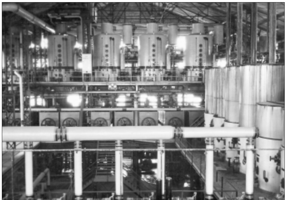
Obr. 4. Z varny argentinského cukrovaru Cuyo v provincii San Juan

Tento cukrovar se nachází v hrabství Norfolk, cca 120 km severně od Londýna. Byl vybudován v roce 1925 a v současnosti patří společnosti British Sugar. V tomto cukrovaru získala v roce 1926 většinou podíl česká firma Škoda. Plzeňská strojírna totiž cukrovar vyprojektovala a vybavila některým zařízením, mimo jiné pro úsek extrakce. Stavbu řídil a prvním ředitelem cukrovaru byl Čech – ing. Václav Zahradník. Vilém Faber byl tedy v Anglii zaměstnancem plzeňské Škodovky od 1. 9. 1929 do 29. 2. 1932, zastával funkci šéfa chemika a zároveň byl asistentem ředitele ing. Antonína Rejthárka. Škoda Plzeň ukončila své působení v cukrovaru Wisington v roce 1936. Vzhledem k tomu, že pracovní