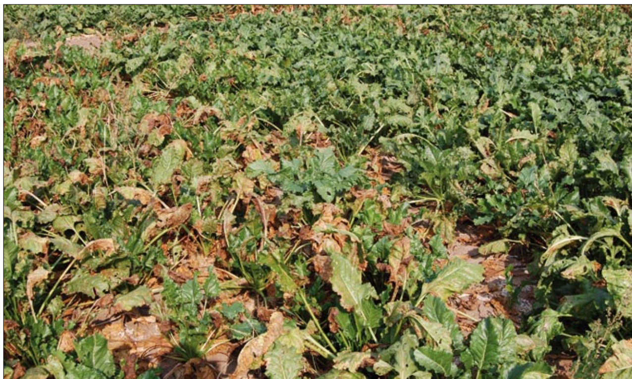
Obr. 1. Amistar Top zajišťuje spolehlivou a dlouhodobou ochranu chrástu – neošetřený porost cukrovky ve srovnání s porostem ošetřeným fungicidem Amistar Top (pokusy Řepařského institutu, lokalita Vyšehořovice, 21. 9. 2009)

rodiny“. Obsahuje účinnou látku azoxystrobin 200 g.l -1 v kombinaci s účinnou látkou difenoconazole 125 g.l -1 , to vše ve špičkové SC formulaci. Účinná látka azoxystrobin patří do skupiny strobilurinů a vyniká systemickými a translaminárními vlastnostmi. Účinek je především protektivní, a proto musí být použit přednostně před nebo na počátku infekce. Azoxystrobin působí dlouhodobě, může tak zabránit vzniku nové infekce po dobu 3–8 týdnů. Účinná látka difenoconazole patří k nejkvalitnějším účinným látkám ze skupiny triazolů. Difenoconazole působí systemicky, má preventivní a silné kurativní účinky . Je absorbován listy a v rostlině se šíří akropetálně a translaminárně. Výsledkem vzájemného působení obou systemických účinných látek s rozdílným mechanismem působení je spolehlivá a dlouhodobá ochrana ošetřených porostů cukrovky proti cercosporióze a padlí . Ošetření přípravkem Amistar Top má pozitivní vliv i na aktivitu listového aparátu, tzv. zelený efekt . Ošetřené rostliny zvyšují efektivitu produkce asimilátů, výsledkem je pak vyšší výnos a cukernatost .