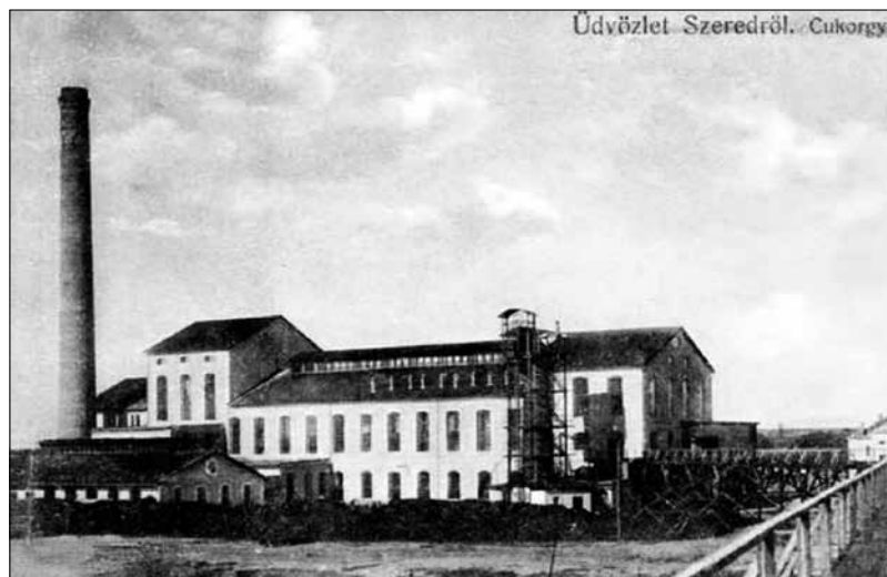
Obr. 1. Novopostavený seredský cukrovar v roku 1908