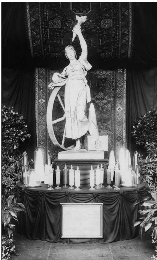
Obr. 1. Alegorie cukrovarnictví v cukrovarnickém pavilonu na Národopisné výstavě v Praze v roce 1895