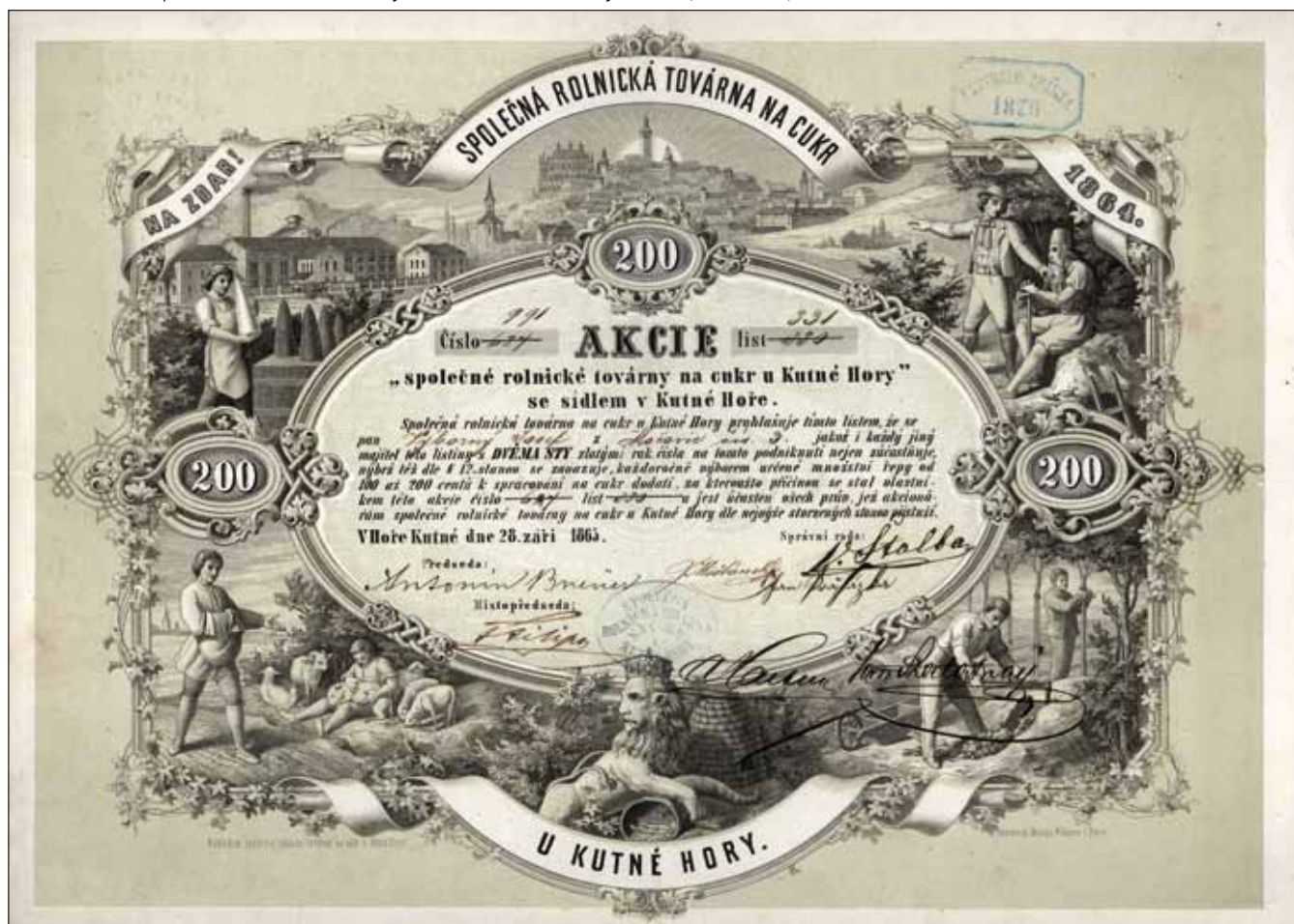
Obr. 4. Akcie Společné rolnické továrny na cukr u Kutné Hory, 1865 (Archiv NTM)

Akcie lze použít i při studiu podoby vlastního cukrovaru, neboť často obsahují i zobrazení cukrovaru. Vyobrazení cukrovaru na akcii může být pouze „ideální“, tj. může být pouze typové nebo