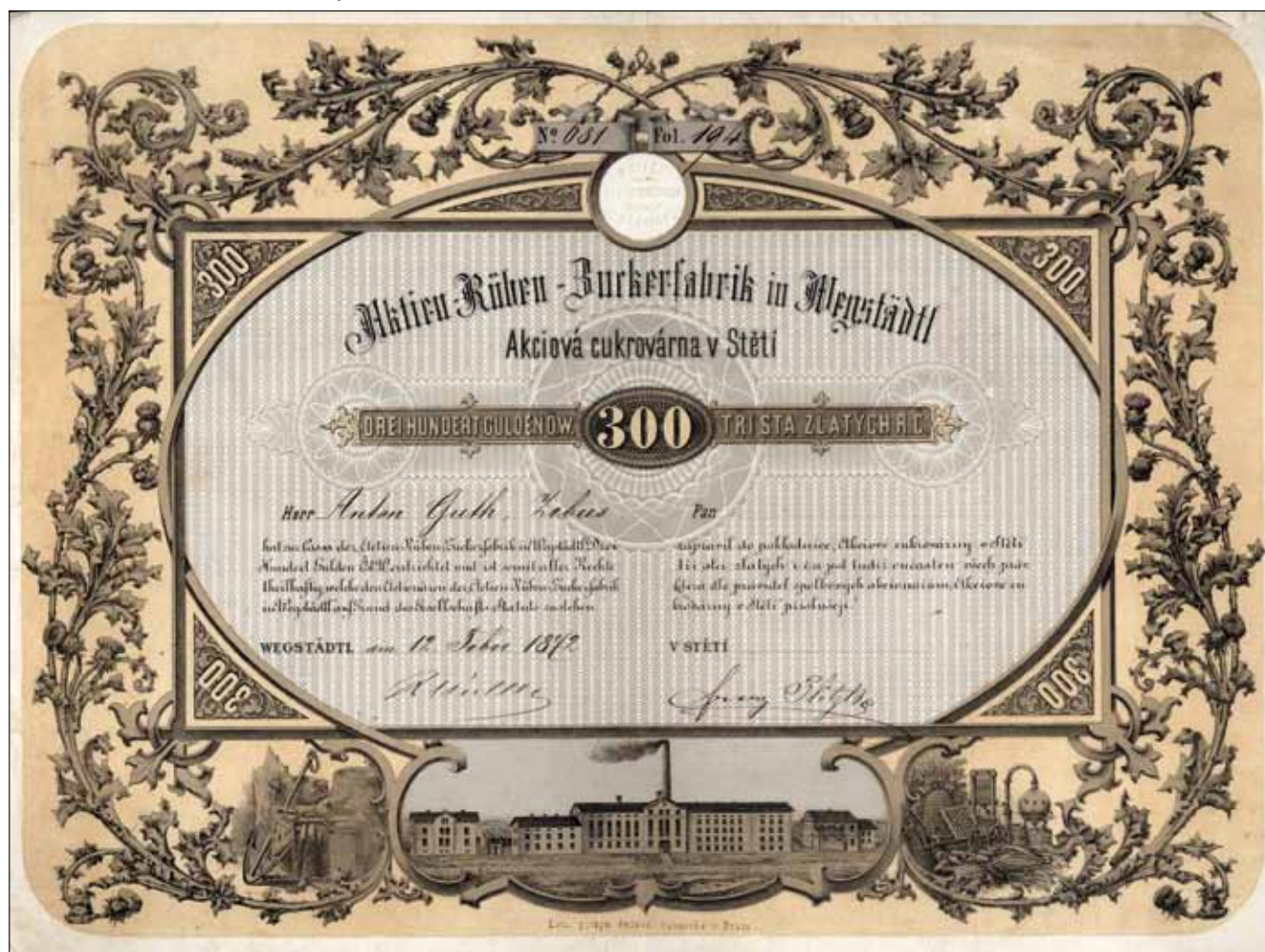
Obr. 11. Akcie Akciové cukrovarny ve Štětí, 1872

Pozn.: Obrazové prameny ze sbírek Archivu Národního technického muzea jsou použity jako obrazová příloha také u některých dalších příspěvků v tomto čísle Listů cukrovarnických a řepářských.