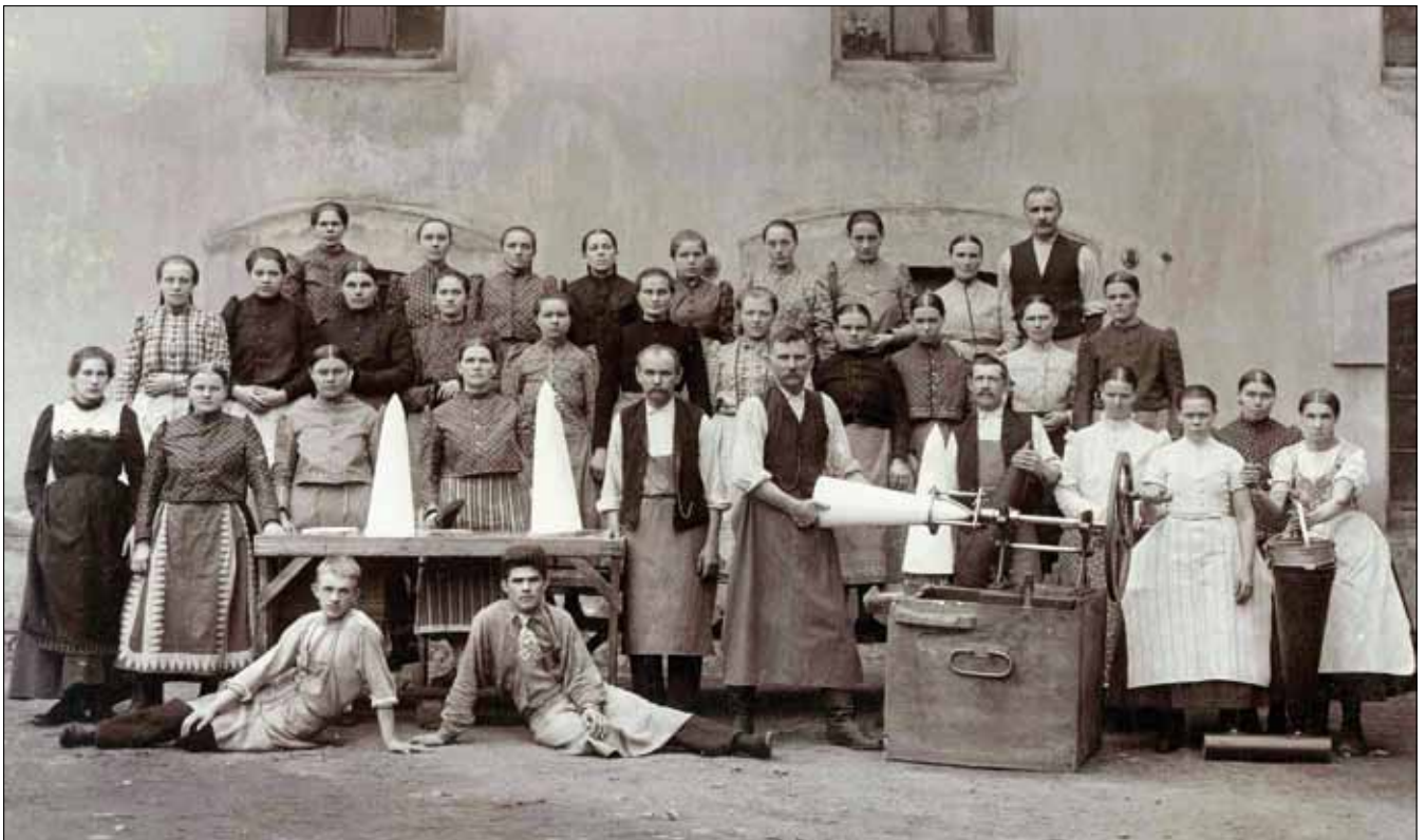
Obr. 3. Fotografie pracovníků homolárny z alba starobrněnského cukrovaru, 1903/1904

V Archivu NTM lze k dějinám cukrovarnictví nalézt jednotlivé fotografie, jejich soubory i celá alba – zachycují exteriéry i interiéry cukrovarů, jednotlivá strojní zařízení, správní budovy či cukrovarské zaměstnance. Příkladem alba, které vzniklo za účelem být reprezentativním souborem fotografií jednoho závodu, je album starobrněnského cukrovaru z přelomu let 1903 a 1904. Nabízí kupříkladu řadu stylizovaných vyobrazení zaměstnanců, a to podle postupných fází výroby, přičemž mezi nejzajímavější patří vybraný snímek pracovníků homolárny (obr. 3.).