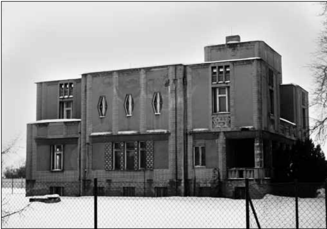
Obr. 2. Reprezentativní kubistická vila E. Králíčka, čp. 147