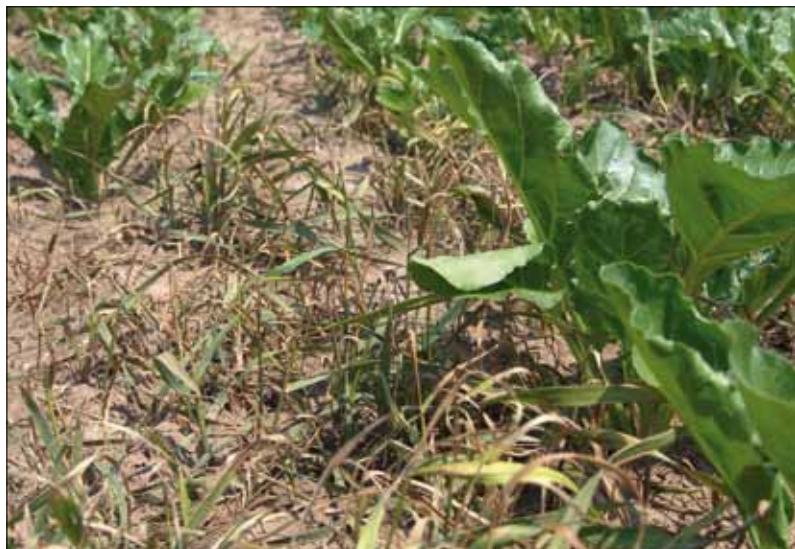
Obr. 3. K potlačení pýru plazivého je obvykle třeba použít vyšších dávek listových graminicidů, případně dělenou aplikaci

jsou pak rychle přetvořeny cytoplazmatickými esterázami na kyseliny a rozváděny cévními svazky (především floemem) po celé rostlině. Listový příjem dimů může být oproti fopům nižší, zejména při horších aplikačních podmínkách.