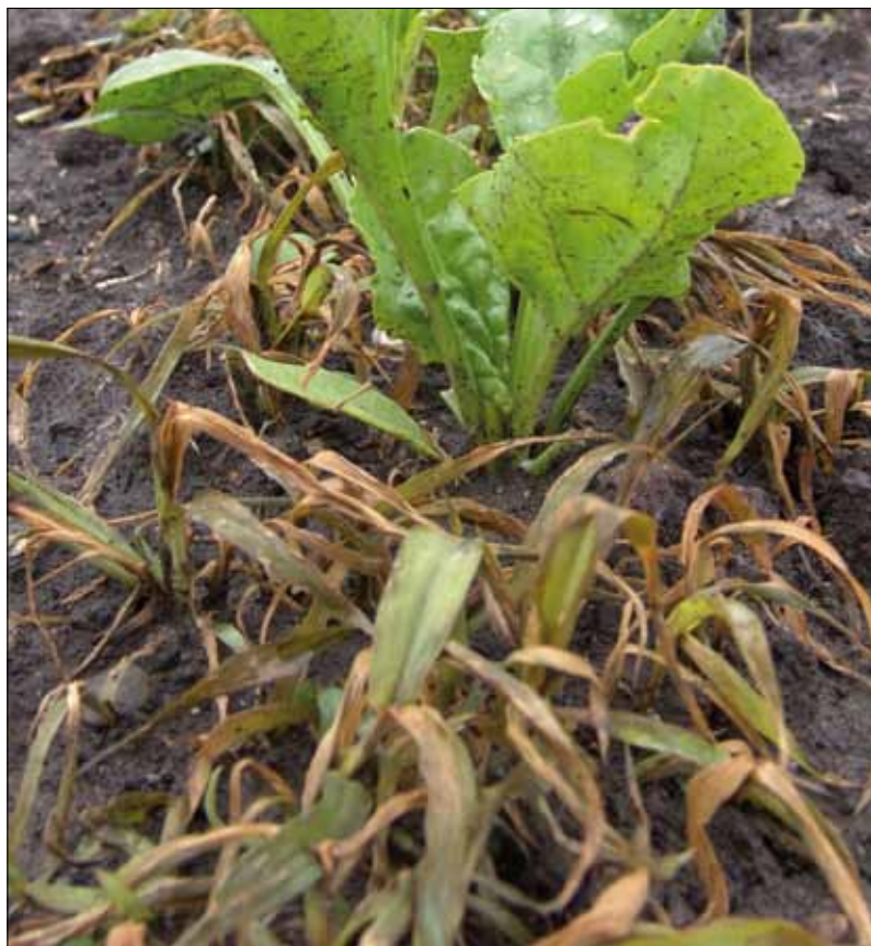
Obr. 2. Ježatka kuří noha je listovými graminicidy spolehlivě potlačována, aplikaci je však třeba provést včas (do konce odnožování)

Inhibitory ACCasy jsou dle chemického členění aryloxy-fenoxypropionáty (jejich isomery) neboli „fopy“, cyklohexandiony neboli „dimy“ a nejnověji také phenylpyrazoliny neboli „deny“ – dosud pouze účinná látka pinoxaden (tab. I.). Herbicidně účinné jsou však pouze R isomery (S isomery obvykle komerční přípravky neobsahují). Většina fopů je formulována jako estery (ethyl, methyl, atd.), které usnadňují příjem a transport do buněk, kde