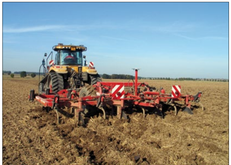
Obr. 1. Traktor Challenger s dlátovým kypřičem HORSCH doplněný hrůbkovacími radličkami na každém druhém tělese (při pracovním záběru 6 m vytváří kypřič 8 hrůbků s roztečí 0,75 m; traktor i kypřič jsou automaticky řízeny podle GPS RTK – systém Autofarm)

zvýšil výnos cukrovky o 5–10 %, přičemž obsah cukru v bulvách se nezměnil. V oblasti Porýní se ale průměrný výnos za použití technologie hrůbkování, oproti konvenčnímu zpracování půdy, nijak nelišil. V rámci těchto pokusů bylo rovněž vypořádáno, že používání hrůbků urychluje uvolňování dusíku dostupného pro rostliny a rovněž zvyšuje jeho množství v půdě. Hrůbkování dále přispívá k jednoduššímu a delšímu kořenovému systému rostlin. Podobné výsledky z pozdějších let (2006 a 2007) a ze stejné oblasti (severní Německo) uvádí také KRAUSE ET AL. (4). Při konečné sklizni v říjnu bylo dosaženo vyššího výnosu bílého cukru u technologie hrůbkování v porovnání s klasickou technologií zpracování půdy; rozdíl ve výnosu činil v tomto případě 8,4 %. Autoři uvádějí, že hlavním faktorem podporujícím rychlý růst cukrovky, je na základě provedené korelační analýzy teplota půdního prostředí. Cukrovka je obecně plodinou, která dovede velmi dobře využívat sluneční záření, a proto jednou z možností, jak zvýšit její výnosy, je prodloužení vegetační doby (2). K tomu může hrůbkování rovněž dobře posloužit, neboť, jak je známo, půda v hrůbkách se dříve prohřívá a umožňuje tak časnější setí.