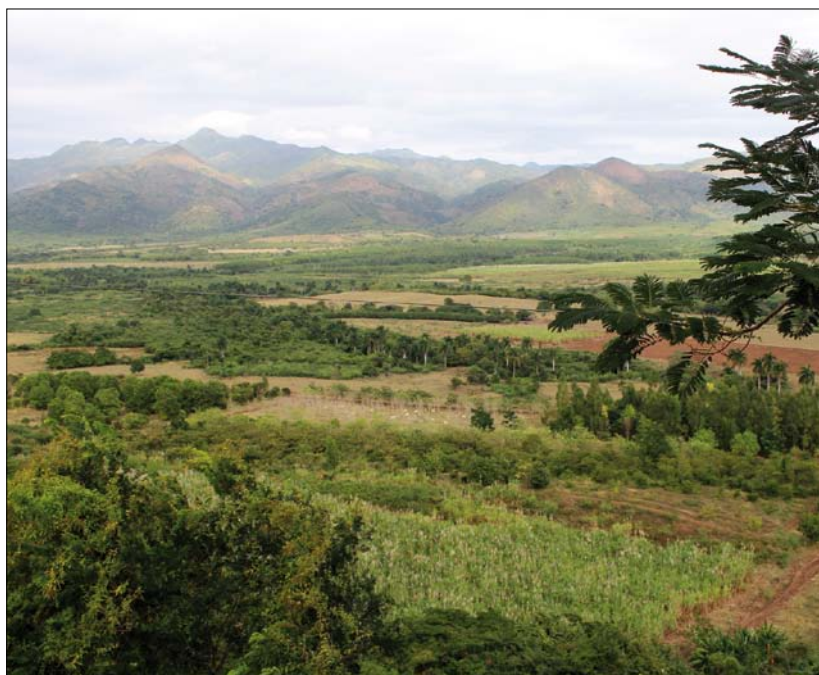
Obr. 1. Valle de los Ingenios (Údolí cukrovarů) v provincii Sancti Spiritus

V článku bude popsána nedávná historie i současnost výroby cukru na Kubě. A to především s důrazem na její ekonomické a sociální dopady na současnou kubánskou společnost a možný další udržitelný rozvoj Kuby.