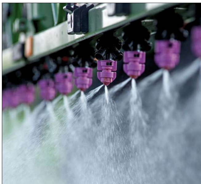
Obr. 1. Dvojštěrbínové trysky TurboDrop HiSpeed

V praxi se pro ochranu rostlin běžně používají jednoštěrbínové a dvojštěrbínové trysky, klasické nebo injektorové s přísáváním vzduchu pro aplikace za větrného počasí. Jednoštěrbínové stříkají hlouběji do porostu a čím rychleji se stříká, tím vodorovnější je směr letu kapek. Tím pádem je i delší čas jejich letu a větší odpar. Ty nejmenší se vypaří dříve, než se vůbec stihnou dotknout listu nebo země. U jednoštěrbínových trysek je vždy více ošetřena přední strana rostliny. Zadní strana je ošetřena minimálně nebo vůbec.