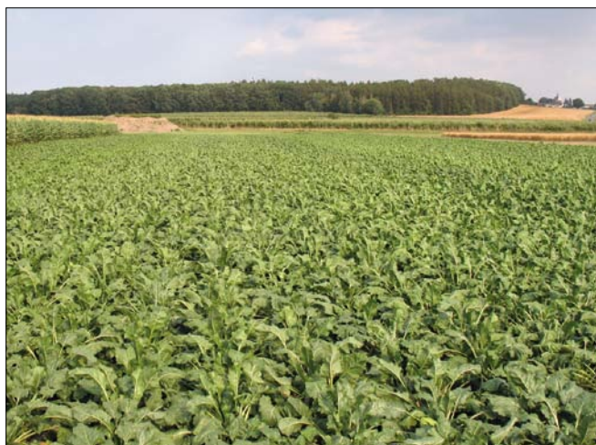
Obr. 1. Conviso Smart systém přinesl zjednodušení herbicidní ochrany cukrovky a vysokou účinnost proti plevelům

Pokud chceme dlouhodobě využívat výhody Smart odrůd, je nezbytné dodržovat doporučení, která vedou k minimalizaci všech případných rizik. Znamená to především důslednou likvidaci vyběhlic a regenerovaných posklizňových zbytků řep (groundkeepers) v následných plodinách a dodržování anti-rezistentní strategie založené na sledování výskytu plevelných druhů a změn jejich chování. Toto se týká nejen cukrovky, ale vždy i ostatních plodin v osevním postupu!