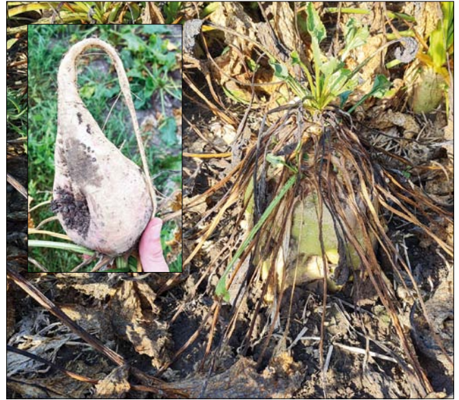
Obr. 3. Gumovitost křídového kořene řepy působená stolburem a vadnutí cukrovky napadené stolburem

Kontrola plevelů v cukrové řepě je další významnou kapitolou a výzvou pro pěstitele a šlechtitele. Díky direktivám EU a přehodnocování účinných látek přípravků na ochranu rostlin, dramaticky ubývá herbicidů v cukrovce a vhodné alternativy pro ochranu cukrovky proti plevelům se bohužel nenabízejí.