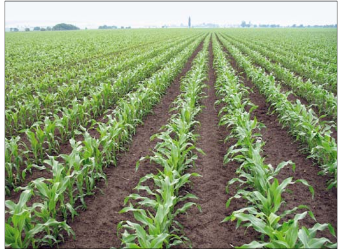
Obr. 2. Anti-rezistentní herbicidní strategii je třeba uplatňovat v celém osevním postupu

časový odstup kukuřice od dalších širokořádkových plodin včetně cukrovky. Mezi alternativní účinné látky v kukuřici patří například terbuthylazine, isoxaflutole, mesotrione, tembotrione, dimethenamid-P, pendimethalin. Použitelné jsou také růstové účinné látky (např. dicamba). V rámci větší pestrosti osevního postupu je vhodné nezařazovat širokořádkové kultury za sebou.