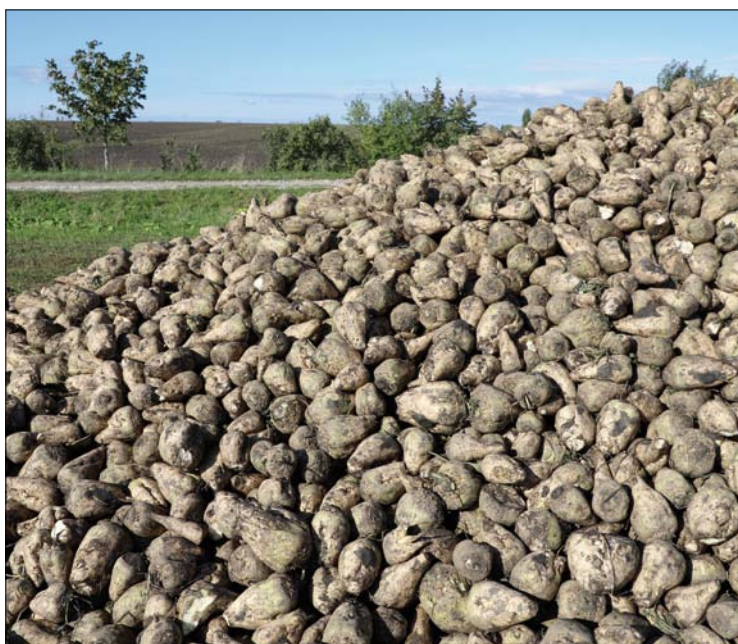
Obr. 3. Přejeme našim partnerům pravidelné vysoké výnosy cukrové řepy