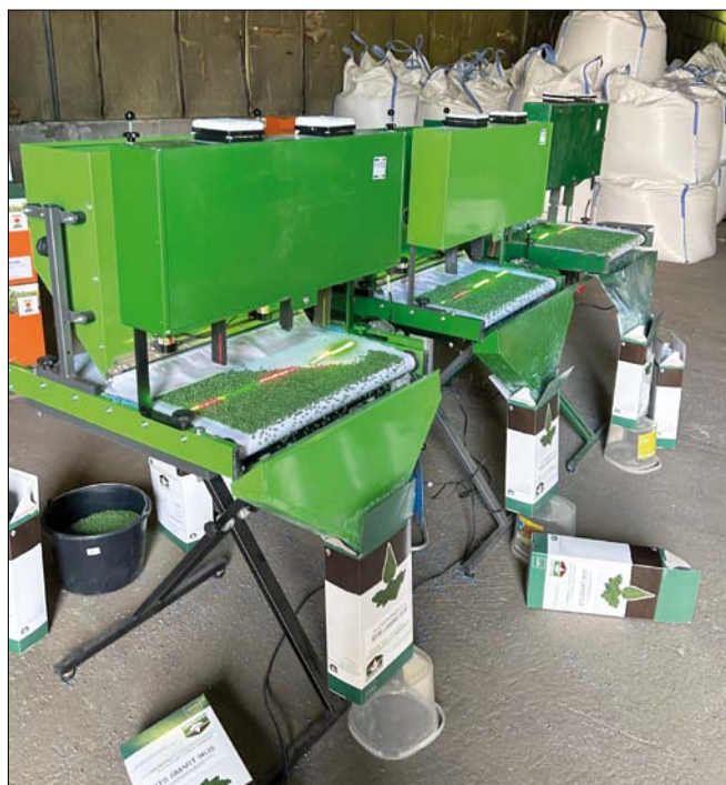
Obr. 1. Laserová stimulace osiva metodou Fytolaser