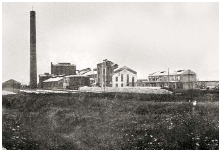
Obr. 1. Cukrovar v Kajali u Burgasu (18)

Uvedený stav přitom nepanoval vždy. I když to dnes může být překvapivé, bývaly doby, kdy byl český čtenář tuzemskými periodiky seznamován s nejnovějším děním na poli bulharského cukrovarnictví. Důvodem pro to byl – jak si ukážeme – především český (podnikatelský) zájem, což mj. dobře dokládá existenci dnes již rovněž zapomenutých vazeb mezi zainteresovanými zeměmi, v jejichž centru se nacházela cukrová řepa a její zpracování.