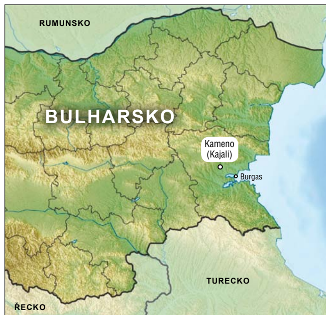
Obr. 3. Lokalizace cukrovaru Kajali (obec Kameno)

Text je dílčím výstupem projektu specifického výzkumu Univerzity Hradec Králové „Sociálně pedagogické aspekty v práci s etnickými minoritami č. 2/II_24“.